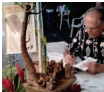
Fotomontagem: Paulo Camelo

"Feliciano - um olhar no infinito" e o lançou na tarde-noite deste 21 de novembro, na sede da UBE-PE.